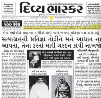
ખેડા સત્યાગ્રહને 100 વર્ષ પૂર્ણ થયા એ નિમિત્તે આ ઐતિહાસિક ઘટનાને સમર્પિત ખાસ પેજ.