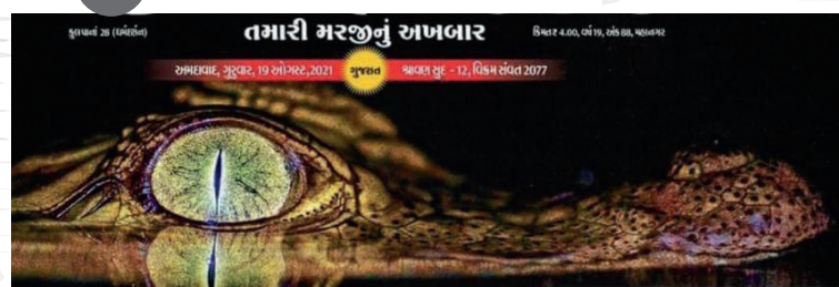
નદીના શાંત પાણીમાં શિકારની વાટ જોઈ રહેલા મગરની આંખની આવી તસવીર પહેલીવાર જોવામાં આવી