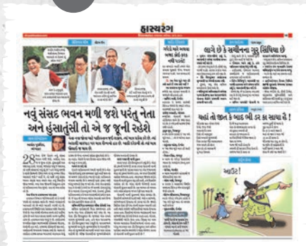
राजकारण, समाजना ताज घटनाकर्म, प्रवालो पर उणवा व्यंग्य लेखोनी संग्रह अने मजेदार कर्तून.