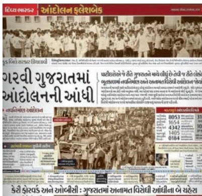
ઐતિહાસિક મહાગુજરાત આંદોલન પર આધારિત દૂર્લભ તસવીરો સાથેનું ભાસ્કરનું વિશેષ પેજ.