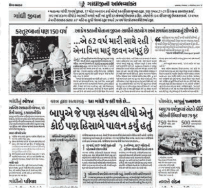
ગાંધી જયંતિ નિમિત્તે બાપુના જીવનના યાદગાર પ્રસંગ તથા દુર્લભ તસવીરો સાથેનું ખાસ પેજ.