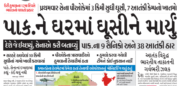
પહેલીવાર સર્જિકલ સ્ટ્રાઈકમાં POKમાં ઘૂસીને આતંકીઓના સફાયાનું કવરેજ.