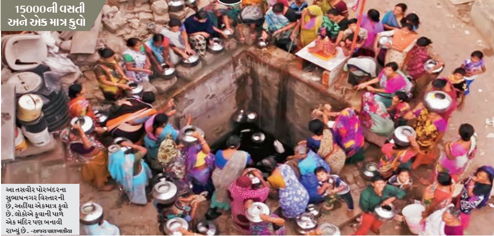
15000ની વસતી અને એક માત્ર કુવો

આ તસવીર પોરબંદરના સુભાષનગર વિસ્તારની છે, અહીંયા એકમાત્ર કુવો છે. લોકોએ કુવાની પાળે એક મંદિર પણ બનાવી રાખ્યું છે.