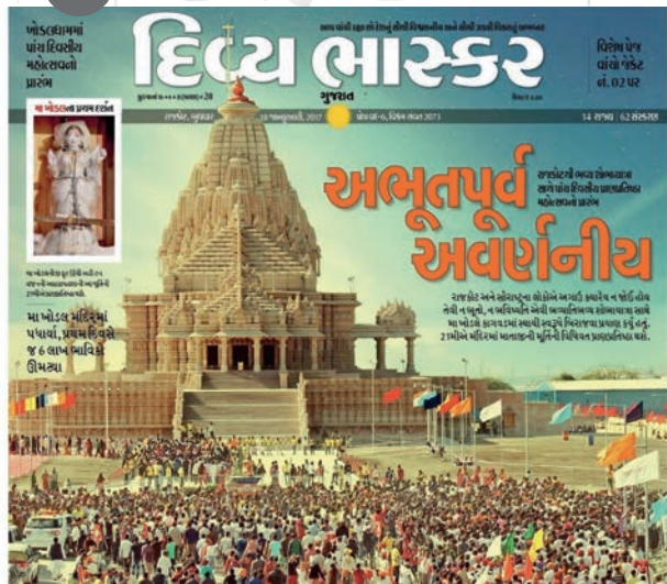
રાજકોટમાં મા ખોડલની ભવ્ય શોભાયાત્રાનું ભવ્ય કવરેજ.