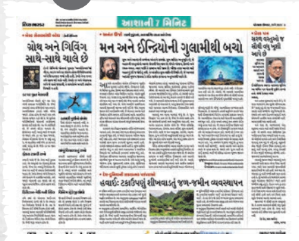
इकारात्मकता, प्रेरणा अने प्रोत्साहनथी सरभर आशांनी 7 मिनिट. दर सप्ताहे प्रकाशित थतुं विशेष पेज्ज.