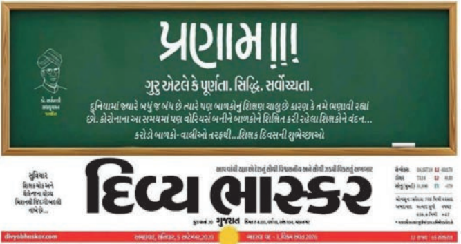
શિક્ષક દિવસ નિમિત્તે ભાસ્કરના માસ્ટરેડમાં જીવનમાં ગુરુના મહત્વને સ્થાન.