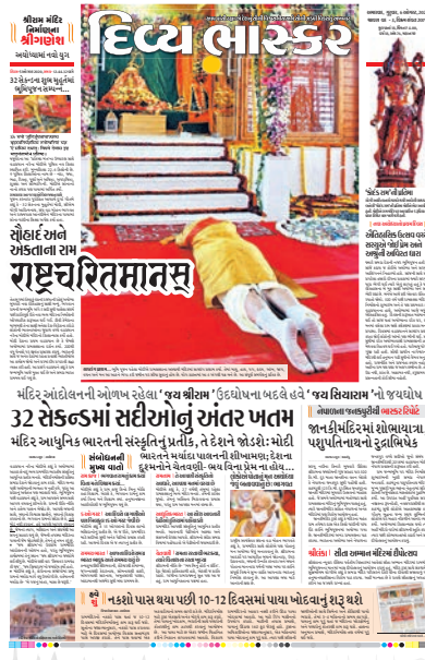
અયોધ્યામાં ભવ્ય રામમંદિરના ભૂમિપૂજન કાર્યક્રમ અને હેડલાઈનમાં 'રાષ્ટ્રચરિતમાનસ' શબ્દપ્રયોગ.