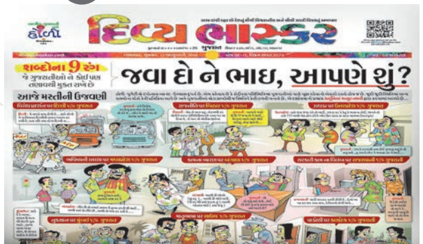
હોળી નિમિત્તે રાજકારણ સહિતની બાબતો પર ચોટદાર વ્યંગ્ય સાથે રજૂઆત.