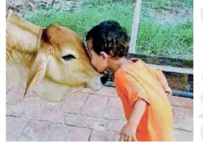
લમ્બી વાદરસથી મૃત ગાયોની તસવીર છાપવાને બદલે ગોમાતા પ્રત્યેની લાગણી વ્યક્ત કરતી ફોટો સ્ટોરી

આ વાદરસથી ગાયોના થયેલાં મોતની તસવીર એટલી ભયાનક છે કે રમને છાપી નથી શકતા.. પણ તેની પીડા સમગ્ર શકીએ છીએ... એ તસવીરોની જગ્યાએ અમે ગોમાના પ્રત્યે લાગણીની આ તસવીર છાપી રહ્યા છીએ કે સંસ્કાર અને શાસન ઝડપથી એમના ઉપચાર માટે સગવડો ઊભી કરે