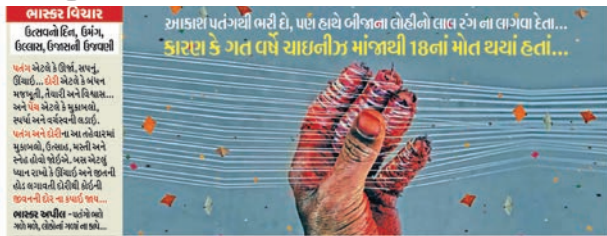
ઉત્તરાયણે ચાઈનીઝ માંજા સામે જાગૃતિનો સંદેશ આપતી ફોટો સ્ટોરી.