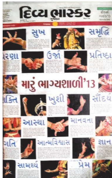
નૃત્યની વિવિધ મુદ્રાઓ દ્વારા જીવનના વિવિધ રંગોની રજુઆત કરતું વિશેષ પેજ.