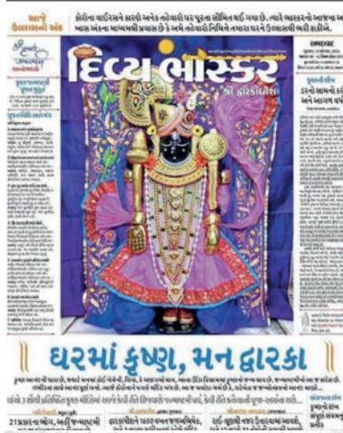
કોરોનાકાળમાં જન્માષ્ટમી નિમિત્તે ખાસ કવરેજ.