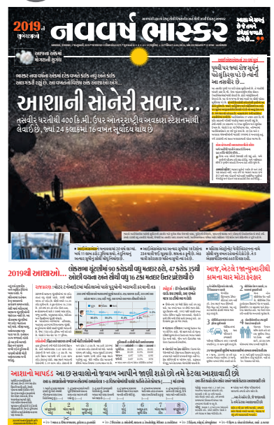
વર્ષ 2019ના પ્રારંભ નિમિત્તે 'ઈન્ટરનેશનલ સ્પેસ સ્ટેશન'માંથી લેવામાં આવેલી પરોઢની યાદગાર તસવીર.