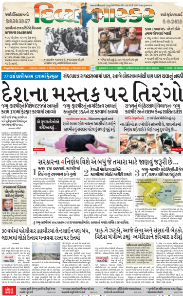
કાશ્મીરમાં કલમ 370 નાબૂદ કરવામાં આવી એ નિમિત્તે 'દેશના મસ્તક પર તિરંગો' હેડલાઈન સાથે કવરેજ.