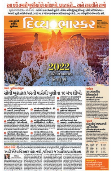
કોરોનાકાળ બાદ 2022ના વર્ષના આરંભ નિમિત્તે 'મુશીઓને અનલોક' કરવાની આશા દર્શાવતું ખાસ પેજ.