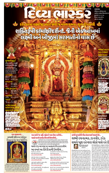
દિવાળીના તહેવાર નિમિત્તે શક્તિરૂપી કામાક્ષી દેવીના દર્શન કરાવતું પ્રથમ પાનું.