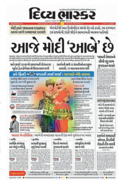
જાપાનના તત્કાલિન PM શિન્જો આબે ગુજરાત આવી રહ્યા હતા ત્યારે હેડલાઈનમાં અનોખો પ્રયોગ.