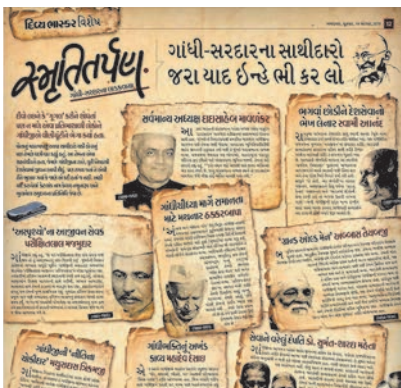
એવા સ્વતંત્રતા સેનાનીઓની વાત જેમણે ગાંધી-સરદારના માર્ગે ચાલીને આઝાદી માટે જીવન સમર્પિત કર્યું હતું.