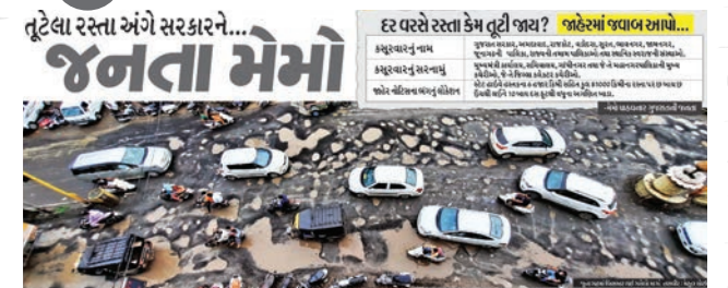
ખરાબ રસ્તા માટે જનતા સરકારને મેમો આપે છે, ભાસ્કરના ફન્ટ પેજ પર અનોખો પ્રયોગ.