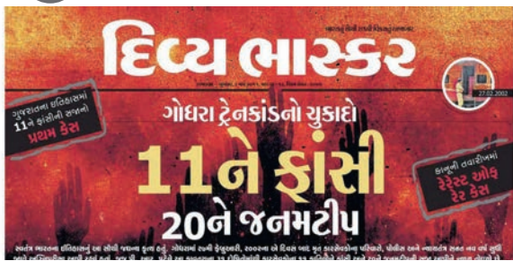
ગોધરા ટ્રેનકાંડના આરોપીઓને સજાના ચુકાદા નિમિત્તે વિશેષ પ્રયોગ.