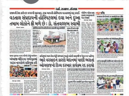
धर्म, समाज अने संस्थाना कार्यकर्मो, अपडेट्सथी वाचकोने वाकेङ्क करावतो दैनिक विभाज.