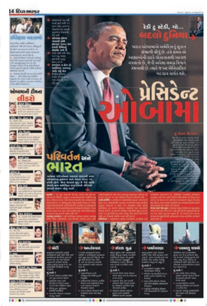
ઓબામા અમેરિકી પ્રમુખ બન્યા ત્યારે તેમની પ્રાથમિકતાઓ, તેમની ટીમ સહિતની વિગતો પર આધારિત કવરેજ.