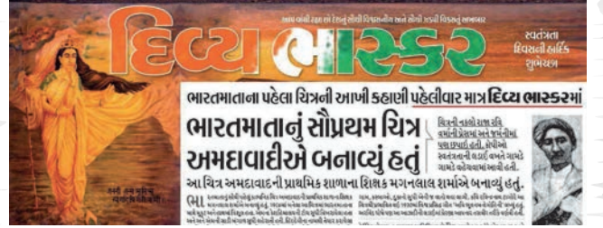
સ્વતંત્રતા દિવસે અમઘાવાદીએ ઢોરેલા ભારત માતાના સૌ પ્રથમ ચિત્રને માસ્ટરેડમાં સ્થાન.