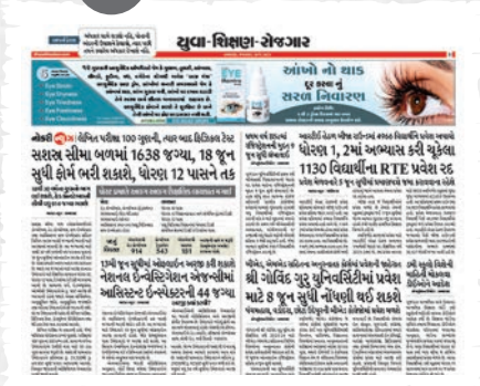
राज्यना युवानोने कारकिर्दी, अभ्यास, नोकरीनी तको वगेरे वेटेस्ट प्रवालोथी वाकेङ्क करतो दैनिक विभाज