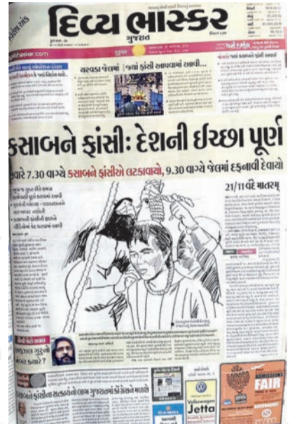
મુંબઈ હુમલાના આરોપી કસાબને ફાંસીની ઘટનાનું ઈલેસ્ટ્રેશન સાથે વિગતવાર કવરેજ.