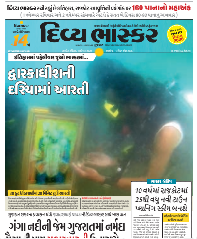
સમુદ્રના પાણી તથે દ્વારકાધીશની આરતીનો ફોટોપ્રયોગ.