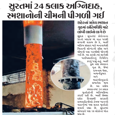
કોરોનાકાળમાં એટલા મોત થતા હતા કે સતત અગ્નિસંસ્કારથી સ્મશાનની ચીમની પીગળી ગઈ હતી