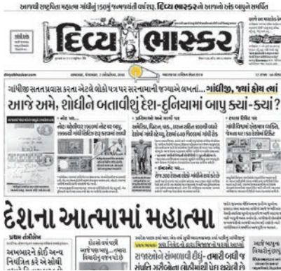
ગાંધીજીની 150મી જન્મજયંતિ વર્ષના આરંભ નિમિત્તે બાપુને અનોખી અંજલિ આપતું ખાસ કવરેજ.