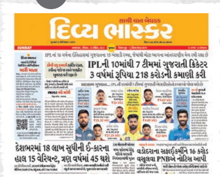
'सन्डे भास्कर'मां भास्करना देशव्यापी नेटवर्कमांथी पसंद करायेली श्रेष्ठ स्टोरीज प्रकाशित थाय छे.