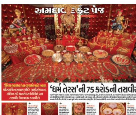
ધનતેરસ દરમિયાન સ્વામિનારાયણ ગાદી સંસ્થાન દ્વારા દર્શાવાયેલા 75 કરોડ રૂપિયાની કિંમતના ઝવેરાતની તસવીર અને હેડલાઈન