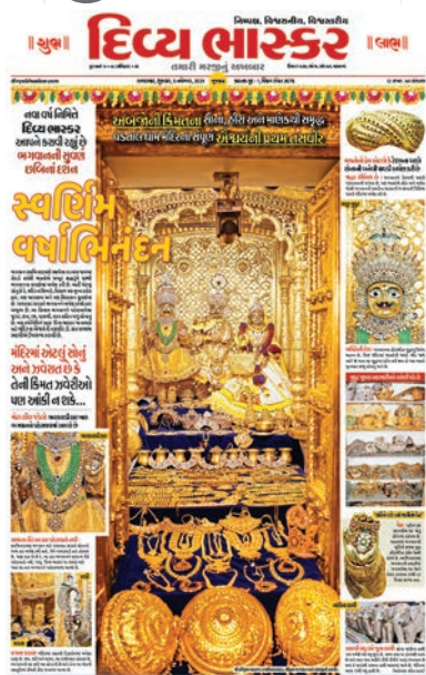
અબજોની કિંમતના સોના, હીરા અને માણેક ધરાવતા વડતાલ મંદિરની આવી તસવીર પહેલીવાર જોવા મળી.