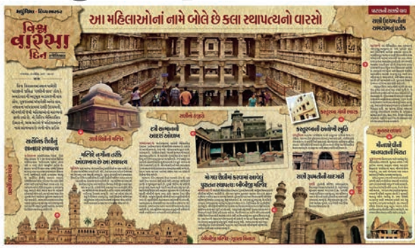
'વિશ્વ વારસા દિવસ' નિમિત્તે ગુજરાતના ભવ્ય સ્મારકો, સ્થળોની રજૂઆત.