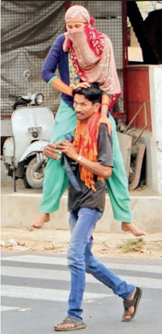
ના, એ કહેતો નથી કે મને તારો ભાર લાગે છે કારણ કે જે પોતાના હોય. એનો આભાર હોય ભાર ન હોય. ના, એ ફરિયાદ કરતો નથી કે મારા પગ દુખે છે. કારણ કે હજુ તો એણે 5 કિમી કાઢ્યા છે, 257 કિમી બાકી છે.

એ કોરોના વાઈરસથી દર નથી ભાગી રહ્યો. એને લાગે છે કે એવા રોગ