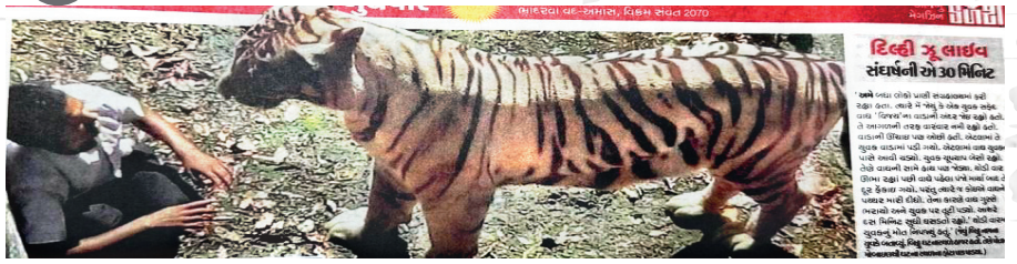
દિલ્હીના પ્રાણીસંગ્રહાલયમાં વાઘના પાંજરામાં પહોંચી ગયેલા મુલાકાતીના 30 મિનિટના સંઘર્ષની તસવીરી ઝલક.