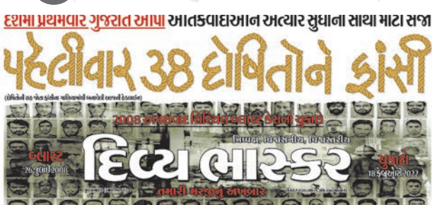
અમદાવાદના શ્રેણીબદ્ધ બોમ્બ બ્લાસ્ટના આરોપીઓને ફાંસીના ચુકાદાનું કવરેજ.