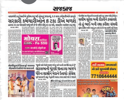
राज्यना राजकारणनी अपडेट्स, नेताओ, मंत्रीओनी कामगोरी पर आरीक नजर राभतो विभाज.