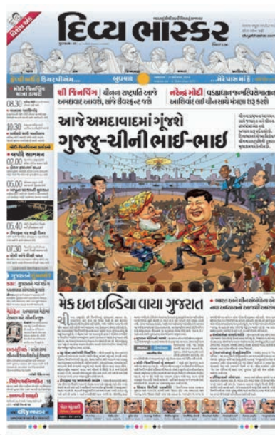
ચીનના પ્રમુખ જિનપિંગ ગુજરાતના પ્રવાસે આવી રહ્યા હતા ત્યારે તમામ વિગતોને આવરી લેતી રજૂઆત.